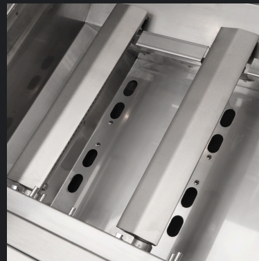
Queimadores de 15.000 BTUs