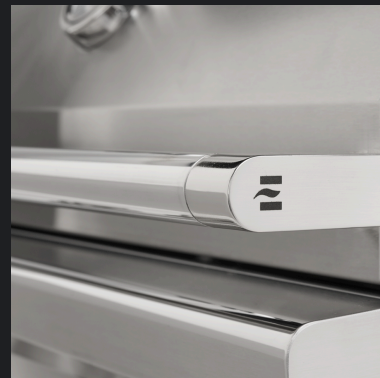
Puxador e Acabamento lateral