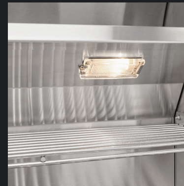
Grelhas de Aço Inoxidável 304